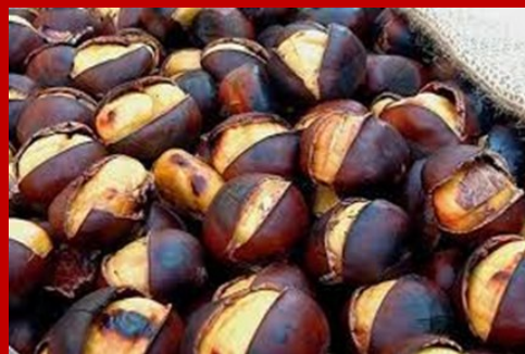
Piazza della Fontana sabato 12 e domenica 13 dalle ore 14 alle ore 21 Caldarroste e Vim Brulè