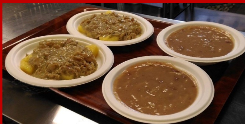
Polenta e Baccalà - Brobrusà

Primo: Brobrusà Secondi: Polenta e Baccalà Polenta, Crauti con Panzeta e Luganega Polenta e Renga Dolci: Strudel Vini della Cantina Sav-Vivallis: Marzemino Merlot - Chardonnay