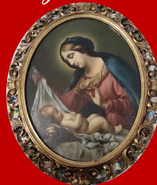
"LA MADONNA COL VELO" DIPINTO DI ATTILIO LASTA DONATO ALL'ASSOCIAZIONE BORGOANTICO